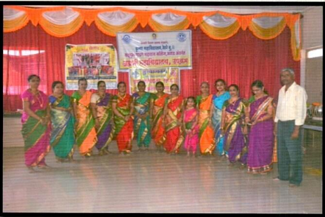
अपबनिनाढ गृप कोयना अशाहत कशाड