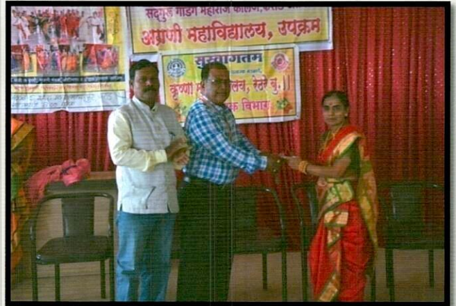
अपगत मान्यपत्र अतिथीचे