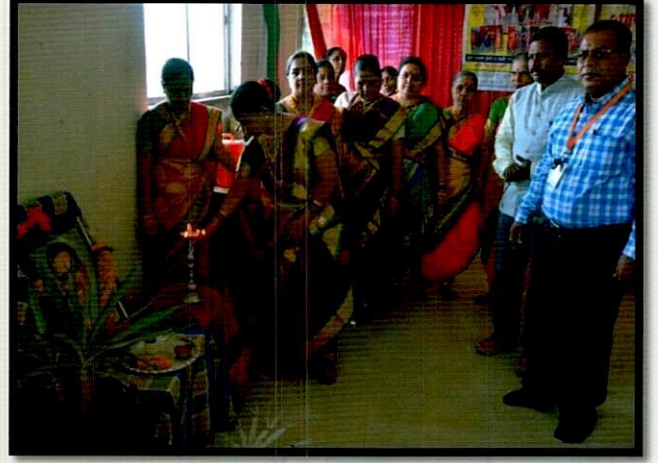
दिपप्रज्वलन व प्रतिमापूजन